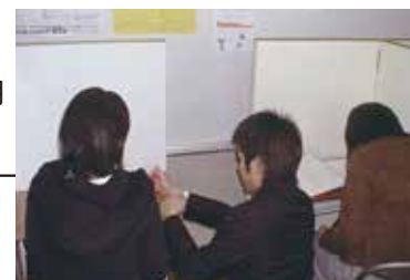
個別コース授業風景